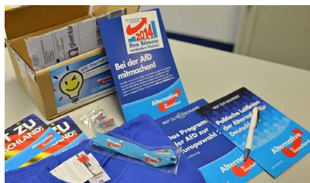
Versand der Willkommenspäckchen hat begonnen

Nutzen Sie bitte die letzte Woche der Kampagne, um im Endspurt noch einmal für unsere AfD zu werben. Ein Blick auf die politischen Nachrichten zeigt Tag für Tag, warum Deutschland unsere Partei braucht. Die Umfragen sind nach wie vor für uns günstig. Gerade hat uns das INSA-Institut auf einen hervorragenden Stimmenanteil von 8,5% taxiert. Wir liegen überall deutlich über 5% und würden derzeit bei allen Umfrageinstituten in den Deutschen Bundestag einziehen. Unser Potential schätzt das INSA-Institut bei 25% ein. Ein Viertel der deutschen Wähler kann sich inzwischen also vorstellen, die AfD zu wählen. Es sollte daher möglich sein, noch mehr Mitglieder zu werben.